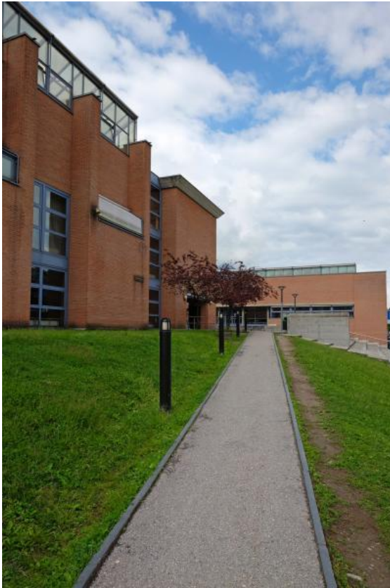
Sede di Cadenazzo