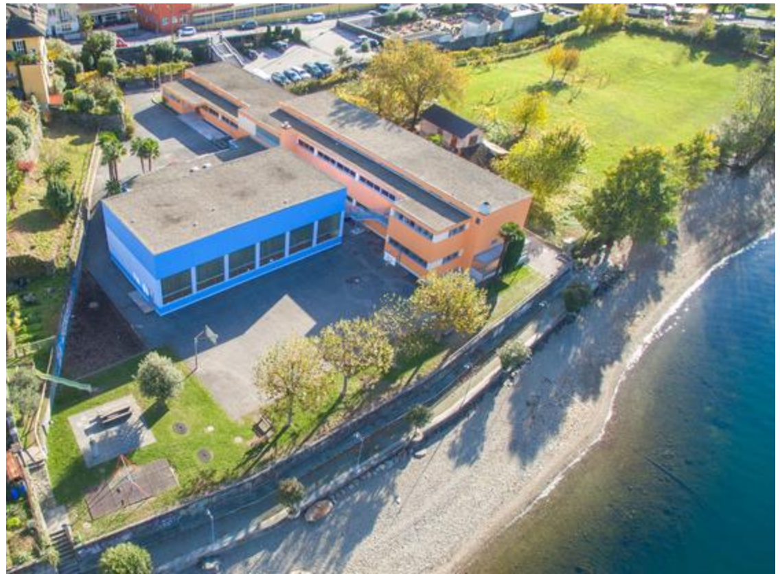
Sottosede di Vira