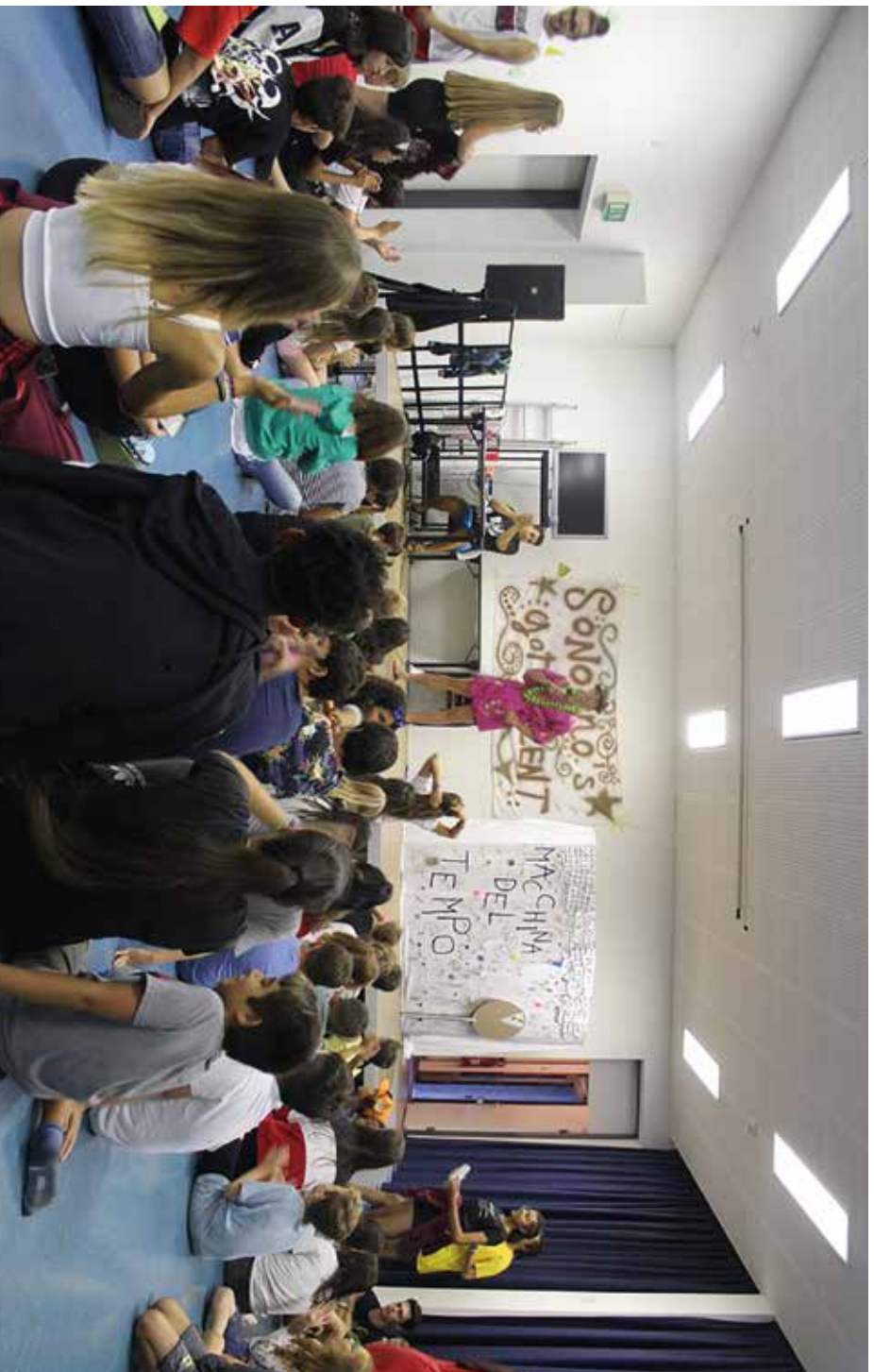
Ci sono solo due lasciti inesauribili che dobbiamo sperare di trasmettere ai nostri figli: delle radici e delle ali.

Dobbiamo imparare dai bambini. Amano senza dubitare. Abbracciano senza avvisare. Ridono senza pensarci. Scrivono cose colorate sulle pareti. Credono ad almeno 10 sogni impossibili.