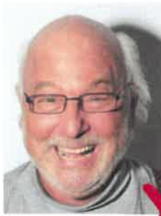
Ombre dietro la testa