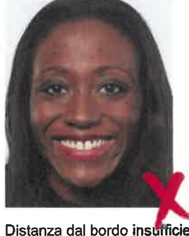
Distanza dal bordo insufficiente