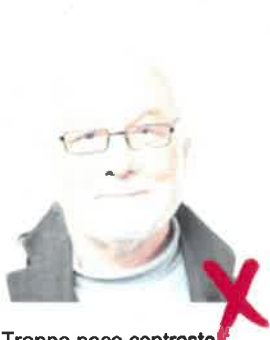
Troppo poco contrasto