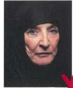
Sfondo troppo scuro