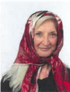
Foulard non ammessi