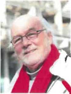
Sfondo in movimento