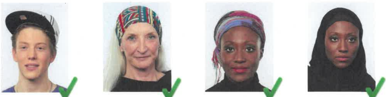
Foto accettata, motivazioni religiose