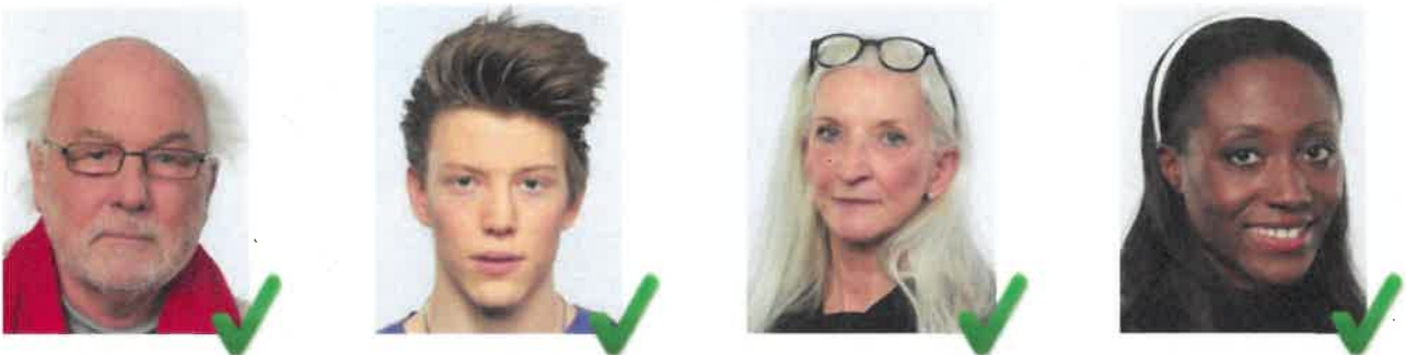
Foto con copricapo