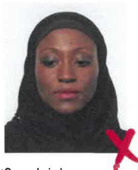
Sguardo in basso