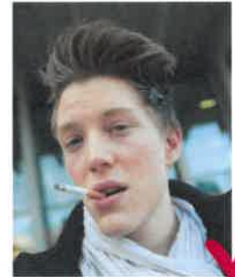
Sigarette non ammessa