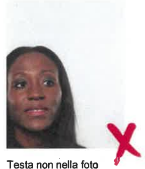
Testa non nella foto