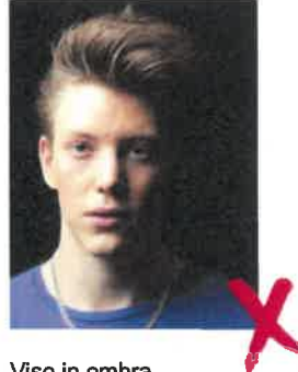
Viso in ombra