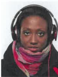
Cuffie non ammesse