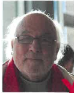
Fonte luminosa sullo sfondo