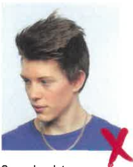
Sguardo a lato