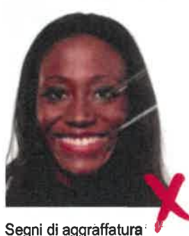
Segni di aggraffatura