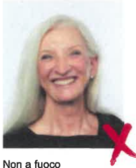
Non a fuoco