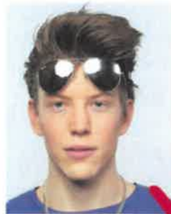
Accessori sul viso non ammessi